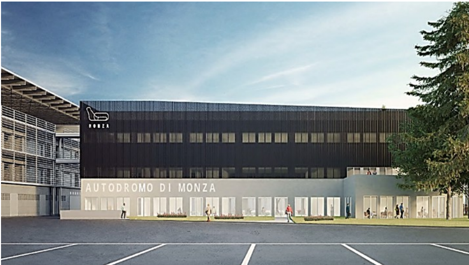
Rendering di parte degli interventi in deroga illustrati nella seduta del Consiglio comunale del 26 marzo 2026.